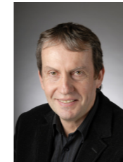
Yves JEAN Prospective urbaine