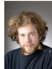
Jules AIMÉ Agence des temps