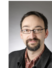
Patrick CORONAS Schéma de stratégie immobilière