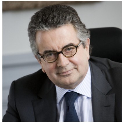
Alain CLAEYS Député-Maire de Poitiers